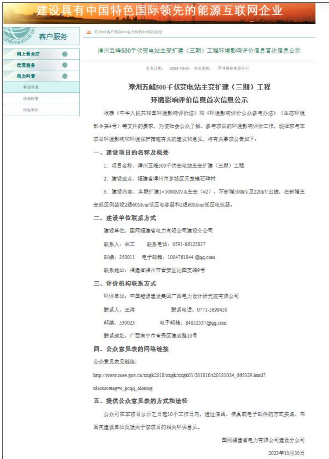
图 3.1 漳州五峰 500 千伏变电站主变扩建（三期）工程首次信息公示