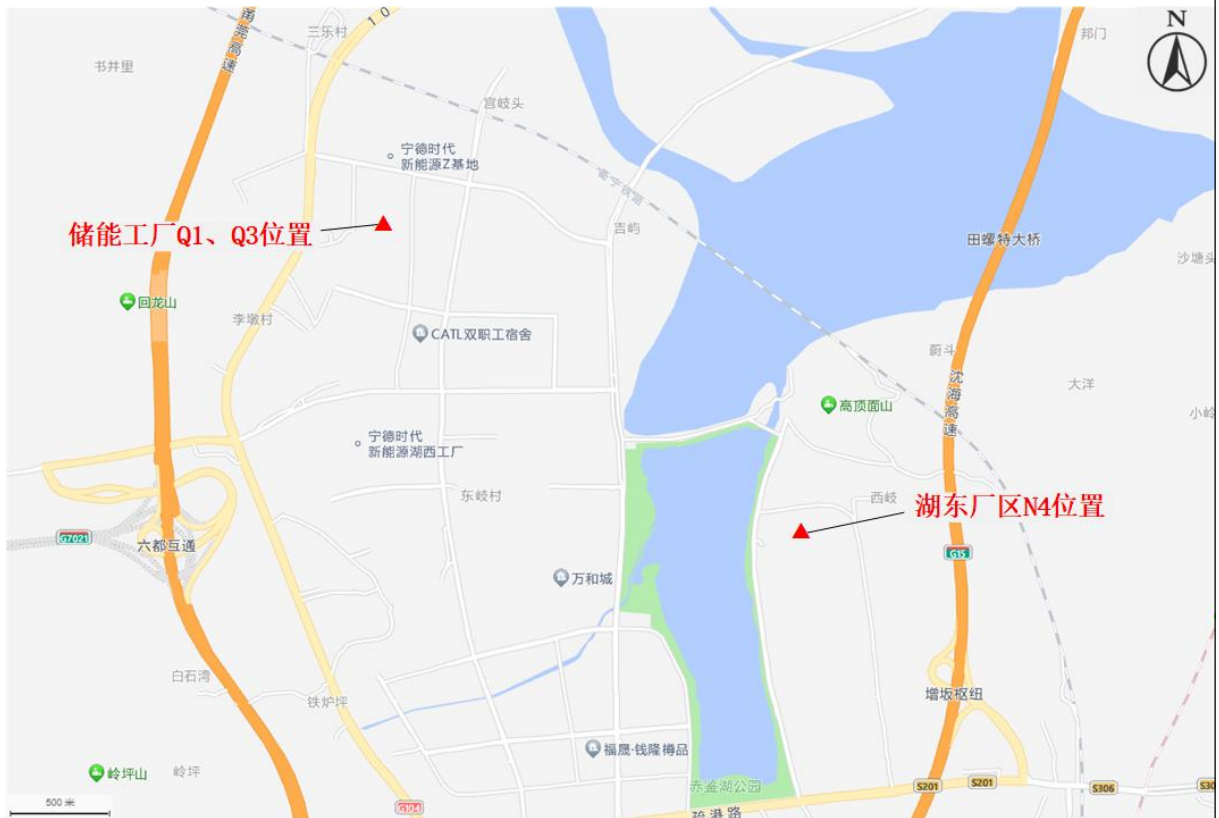
图 1-1 项目地理位置图

建设单位位于福建省宁德市蕉城区漳湾镇新港路 2 号，3 台 CT 机项目分别位于湖东厂区 N4 栋厂房 4 层 CT 室、储能工厂 Q1 栋厂房 4 层 L91 拉线区 CT 检测区、储能工厂 Q3 栋厂房 1 层 CT 检测区，项目地理位置详见图 1-1。