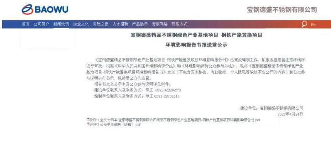
图 5.2-1 报送前公示截图