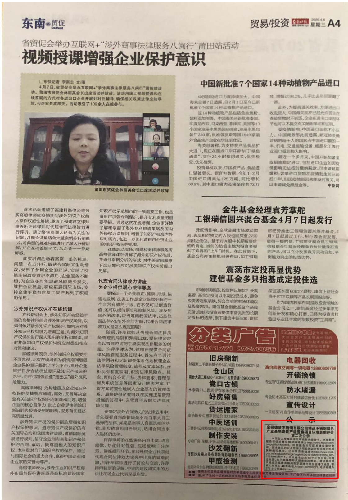
图 3.2-2 2020 年 4 月 8 日登报情况

《东南快报》，属于建设项目所在地公众易于接触的报纸。符合《环境影响评价公众参与办法》（部令 第4号）第十一条的要求。