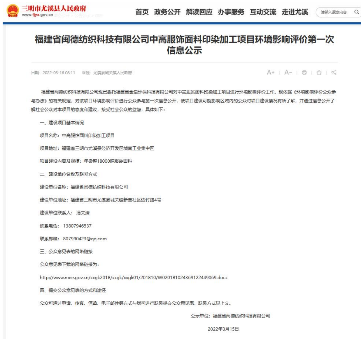
图 2.2-1 第一次网络公示图

建设单位于 2022 年 3 月 15 日发布的第一次公示的网络截图见图 2.2-1。