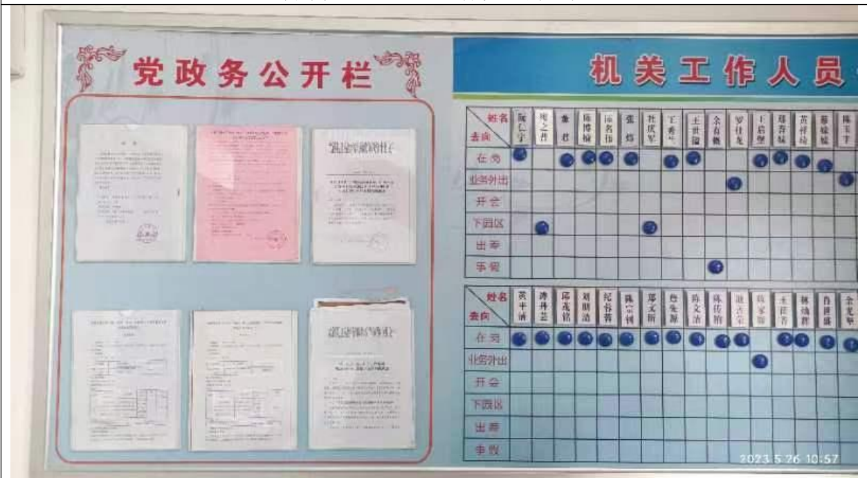
三明市尤溪县人民政府管委会公告栏