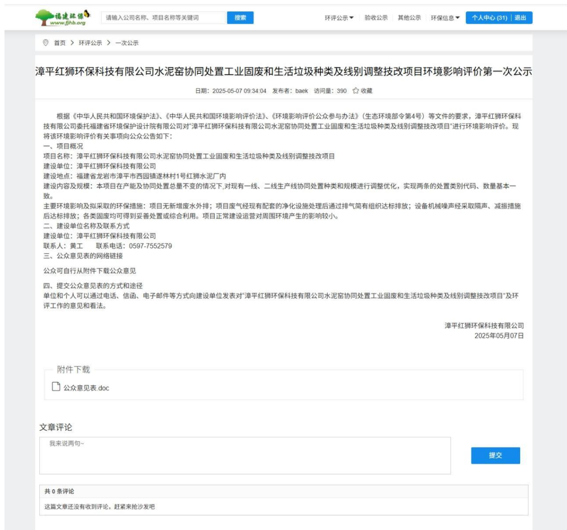
图 2.2-1 第一次网络公示

建设单位于 2025 年 5 月 7 日在“福建环保网”（网址： https://www.fjhb.org/huanping/yici/38549.html ）进行了“漳平红狮环保科技有限公司水泥窑协同处置工业固废和生活垃圾种类及线别调整技改项目 环境影响评价信息第一次公示”，公示截图见图 2.2-1。