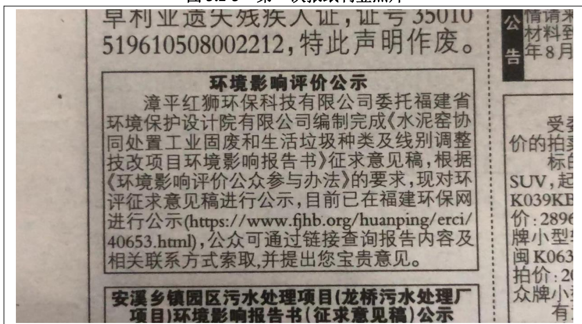
图 3.2-4 第二次报纸刊登照片