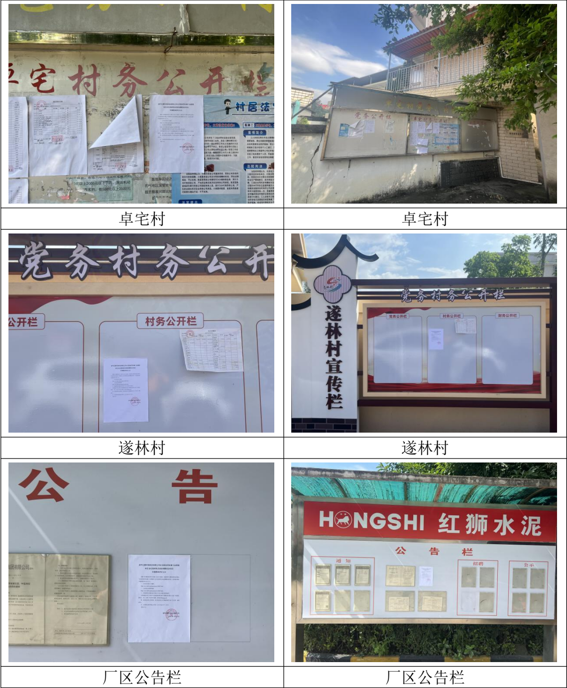
图 3.2-2 第二次现场张贴公示照片

项目环境影响报告书征求意见稿公示选择在海峡都市报上刊登，公示期为 10 个工作日（2025.7.28 -2025.8.8），且在征求意见期间内公开信息不少于 2 次，第一次为 2025.7.29，第二次为 2025.7.30，公示照片详见图 3.2-3~3.2-4。